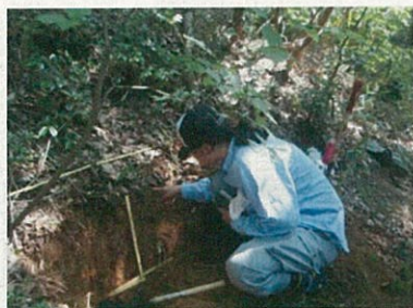
土壌断面調査状況

新名神高速道路計画地周辺において、土壌断面調査、土壌貫入試験、溪流調査等を行います。