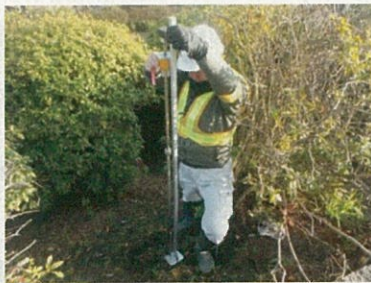
土壌貫入試験状況